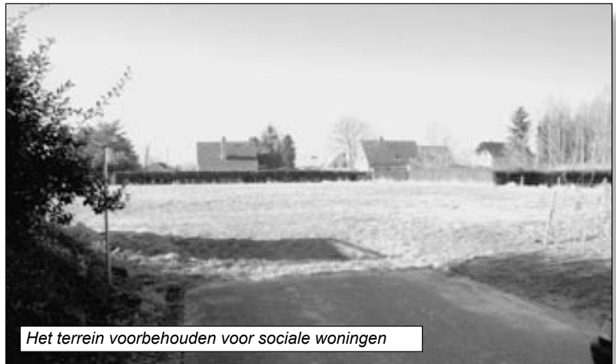
Het terrein voorbehouden voor sociale woningen

Kernpunt van het bezwaar is de verdichting van de bebouwing in de wijk, bezwaren rond stratentracés, onteigeningsplannen, en de te verwachten verkeersproblemen: de wijk heeft immers slechts twee "uitgangen": het onveilige kruispunt van de Boslaan met de Waversebaan en de Winkelweg. In de bezwaarschriften wordt betwist dat de norm van 11,5 woningen per hectare ook voor dit soort gebied bedoeld is. En informeel wordt gewezen op de grondspeculatie en voordelen voor een reeks van eigenaars van percelen: daarin ziet men vooral de resultaten van het Fusiebelangen-dienstbetoon. Toch was er op de gemeentelijke commissie voor ruimtelijke ordening, de officiële adviesraad, een vrij grote consensus om het nieuwe plan door te zetten. Ook de commissie van de gemeenteraad deelde dat standpunt.