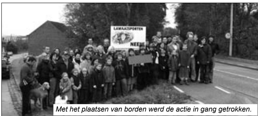
Met het plaatsen van borden werd de actie in gang getrokken.

• In 1987 pogde de gemeente van een gedeelte van het gebied een ambachtelijke zone te maken. Daar kwam toen fel protest tegen, ondermeer een petitie ondertekend door 3700 inwoners. Dat leidde tot een