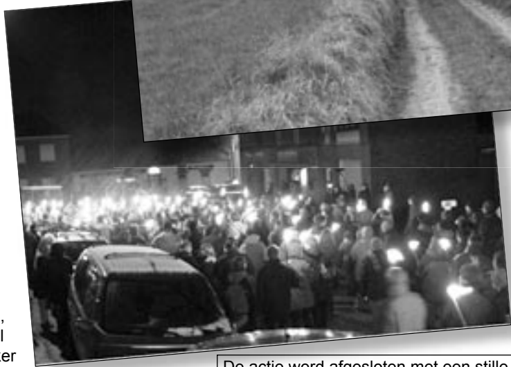
De actie werd afgesloten met een stille fakkeltocht