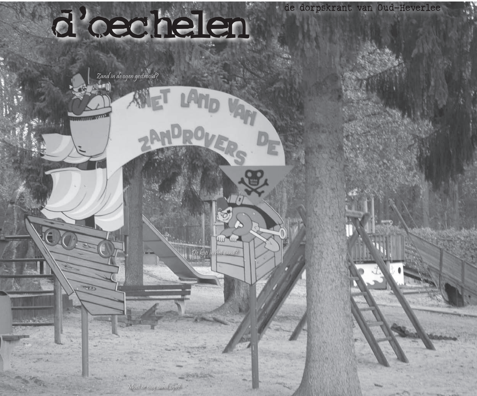
Zand in de ogen gestrooid?

nummer 143 december 2007 de dorpskrant van Oud-Heverlee