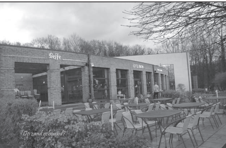
Op zand gebouwd?